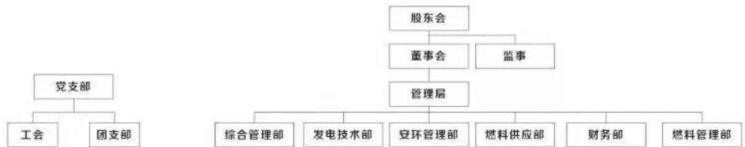
上海电气（天长）生物质发电有限公司 公司治理结构图