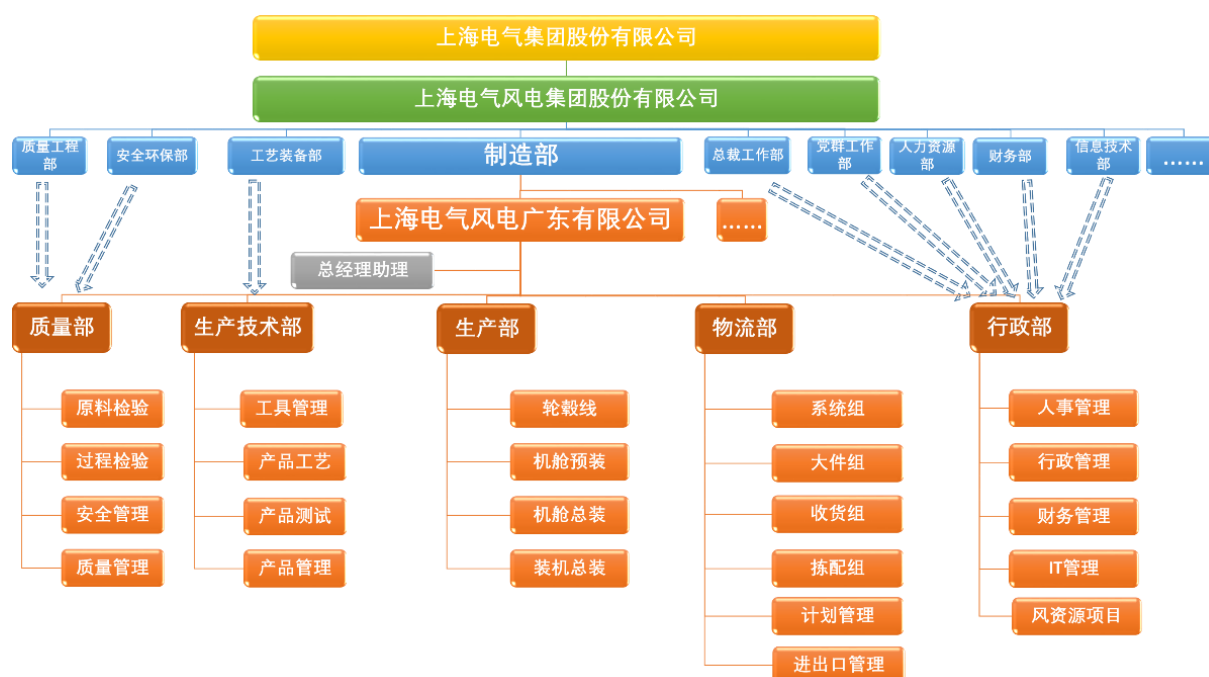
组织架构图（内部职能部门）